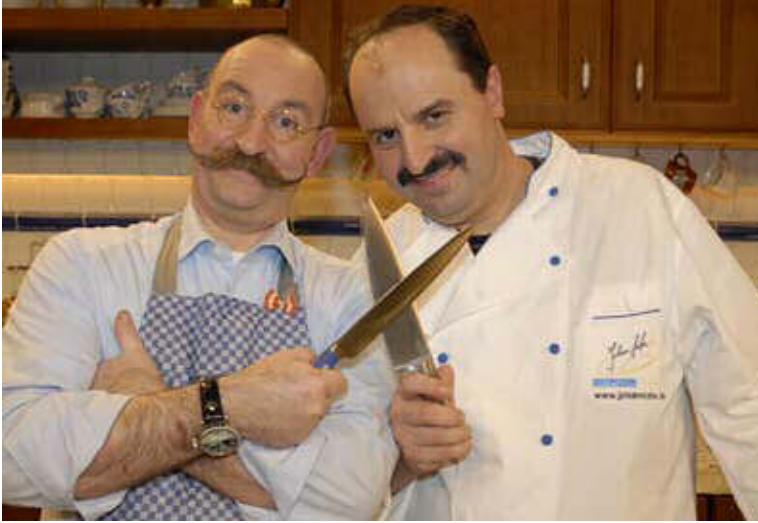
Die Spitzenköche Johann Lafer (rechts) und Horst Lichter sorgen für „Spaß und Genuss“.