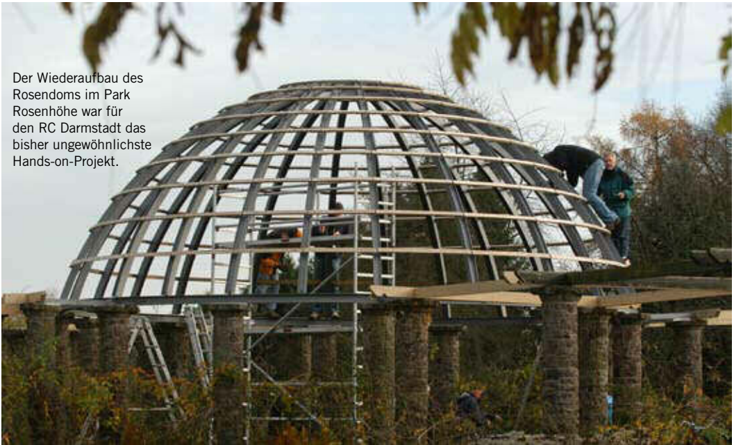
Der Wiederaufbau des Rosendoms im Park Rosenhöhe war für den RC Darmstadt das bisher ungewöhnlichste Hands-on-Projekt.

Auf das Darmstädter Vorbild ist nicht nur der Vater des Projekts, Rot. Hans-Rolf Ropertz, stolz. Eberhard Uhland, mit dessen Einsatz und handwerklichem Rat die Sache der „großen rotarischen Rasselbande“ blühte und gedieh, blickt selbstbewusst-bescheiden zurück: „Mir kam das Ganze manchmal vor wie ein Ferienlager mit dem Märklin-Baukasten. Nur die Teile waren größer. Und die Menschen, die sie montiert haben, waren älter.“