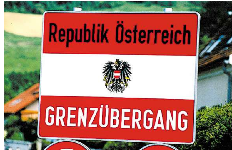
Österreichische Firmen verlassen immer öfter das Land, um jenseits der Grenzen Geschäfte zu machen, vor allem in Osteuropa.

In Retznei haben die Saubermacher gemeinsam mit dem französischen Zementhersteller Lafarge eine Firma gegründet, die Müll so rein sortiert, dass er als Brennstoff fürs Zementwerk taugt. Die Arbeit besorgen vier riesige Zerkleinerer, deren gewaltiger Appetit und deren